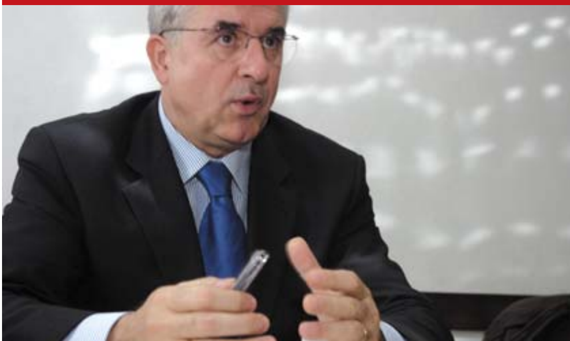
BOSMAL "Iskreno, ponuda koju je dao po mom je sudu izuzetno dobra. U svojoj aktivnosti tokom rada u Vijeću ministara bavio sam se istraživanjima iz oblasti koncesija i uvjerio se da su rijetki oni koji bi ponudili gradnju autoputa na konceptu DBOT-a"